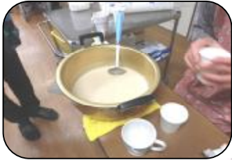
甘酒がふるまわれました