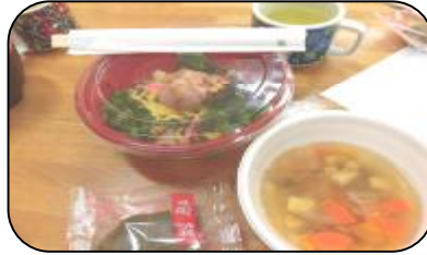
昼食は「特製ネギトロ丼」